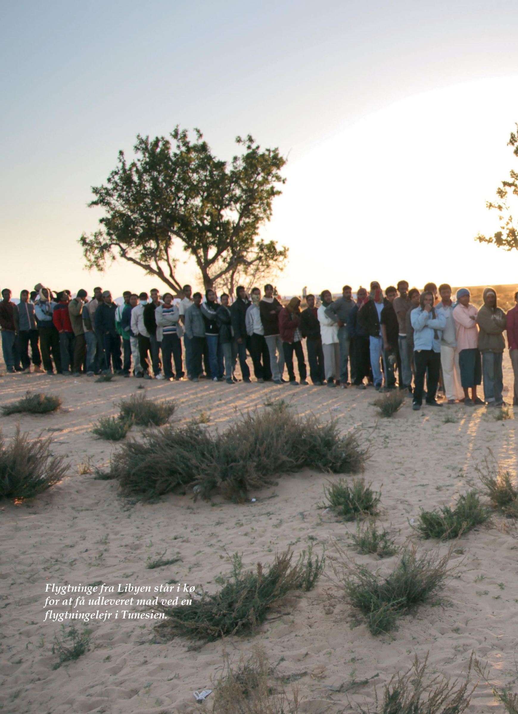
Flygtninge fra Libyen står i kø for at få udleveret mad ved en flygtningelejr i Tunesien.